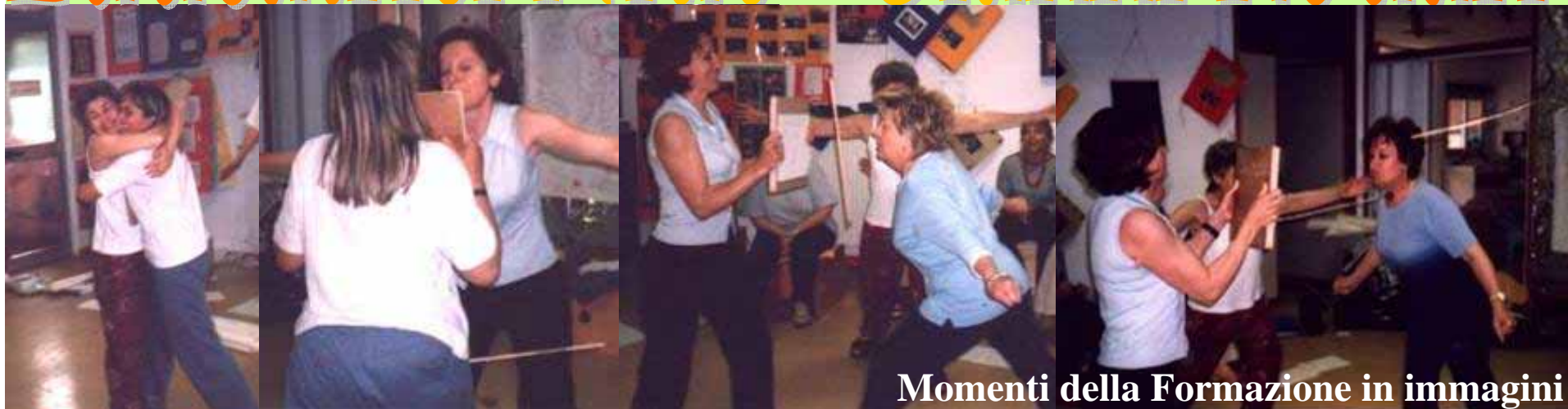
Momenti della Formazione in immagini