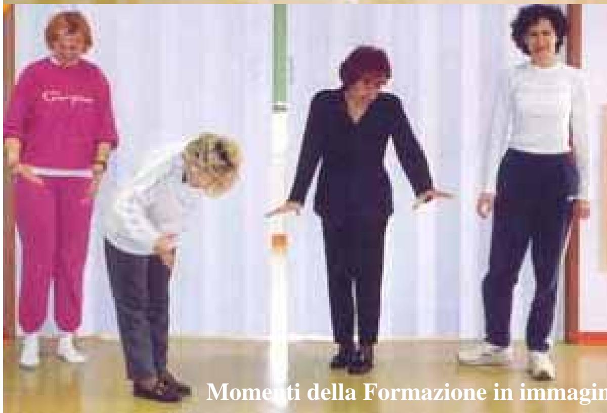
Momenti della Formazione in immagini