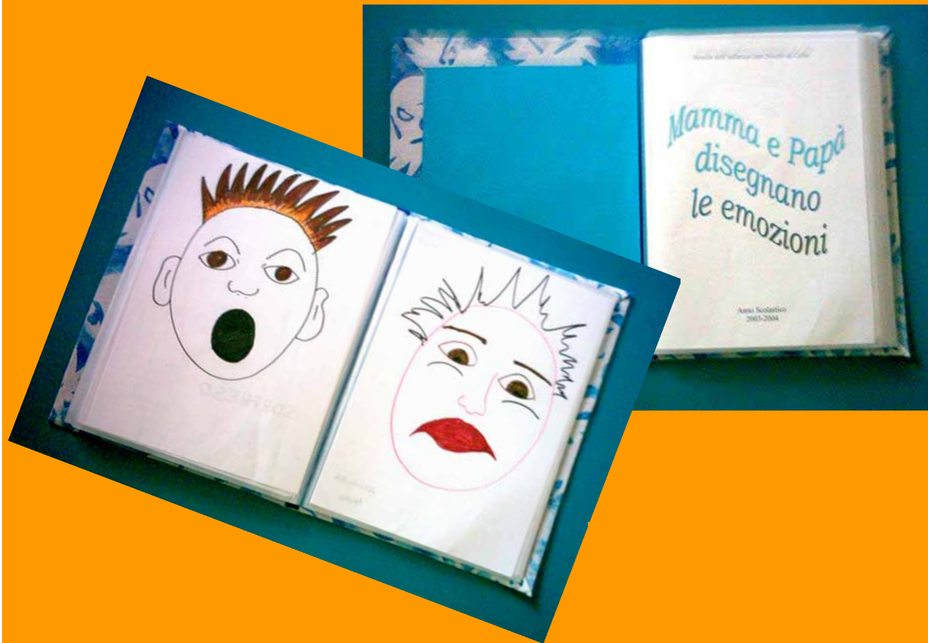
Le carte delle emozioni